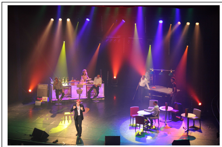
Théâtre Sébastopol - Soirée Spotlight