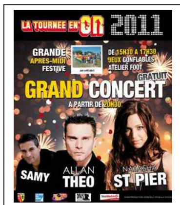
Tournée en Or 2011

Dès juin, nous sommes partis en Tournée d'été avec le Car Podium 65m 2 en collaboration avec DIVAN Production .