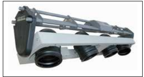
CS4 STUDIO DUE

Nous avons attendu que la technologie des LED évoluent nettement pour pouvoir investir 3 types différents de projecteurs et surtout la toute dernière venue : WILDSUN500 la Lyre à LED RGB + W Zoom 10 000 lumens, pilotable en WIFI , de concepteur Ayrton (l'un des plus prestigieux fabricants de LED)