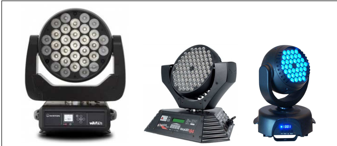
WildSun 500 Ayrton - Variled 384 JB Lighting - MaxKolor36